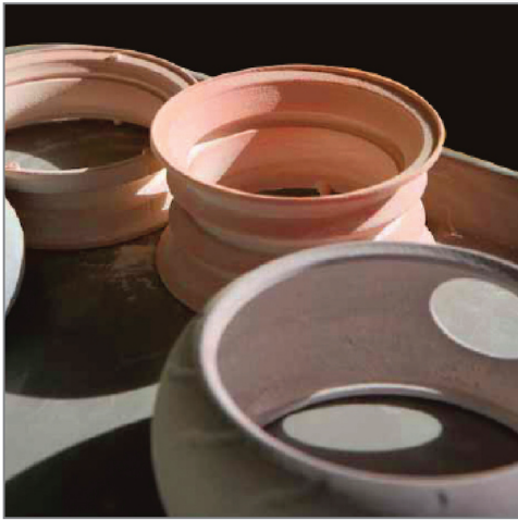
5분의 1 크기의 자동차 모델을 위한 바퀴들과 바퀴테들

“디자인 주기를 통한 Z프린터 모델들의 생산은 더 좋은 상품들과 빠르고 더 선택적인 시제품화의 기술을 불러일으킵니다. 그리고 이는 학생들에게 그들이 직업을 준비하는 데 있어 더없이 훌륭합니다.”