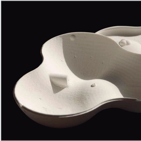
전자제품을 위한 덮개