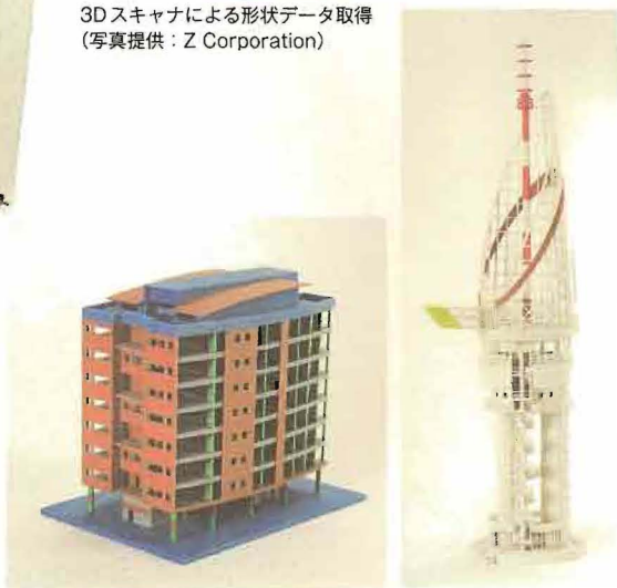
出力された形状データ