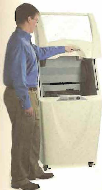
3Dプリンタによるデータ出力