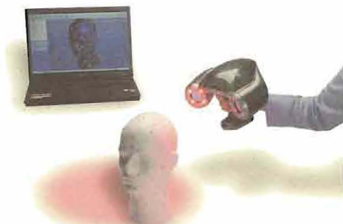
3Dスキャナによる形状データ取得